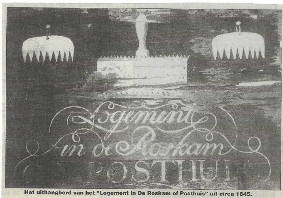
Het uithangbord van het "Logement in De Roskam of Posthuis" uit circa 1845.

Buitenpost heeft enkele eeuwenlang ook een befaamde herberg gehad, t.w. "De Roskam" aan het kruispunt van de rijksstraatweg (Voorstraat) met de Kuipersweg en de Stationsstraat. In oude koopakten wordt ook de naam "Posthuis" genoemd. Deze naam herinnert aan de functie die dit gebouw vroeger had als halte en wisselplaats van de postkoets en dat de postmeester hier woonde.