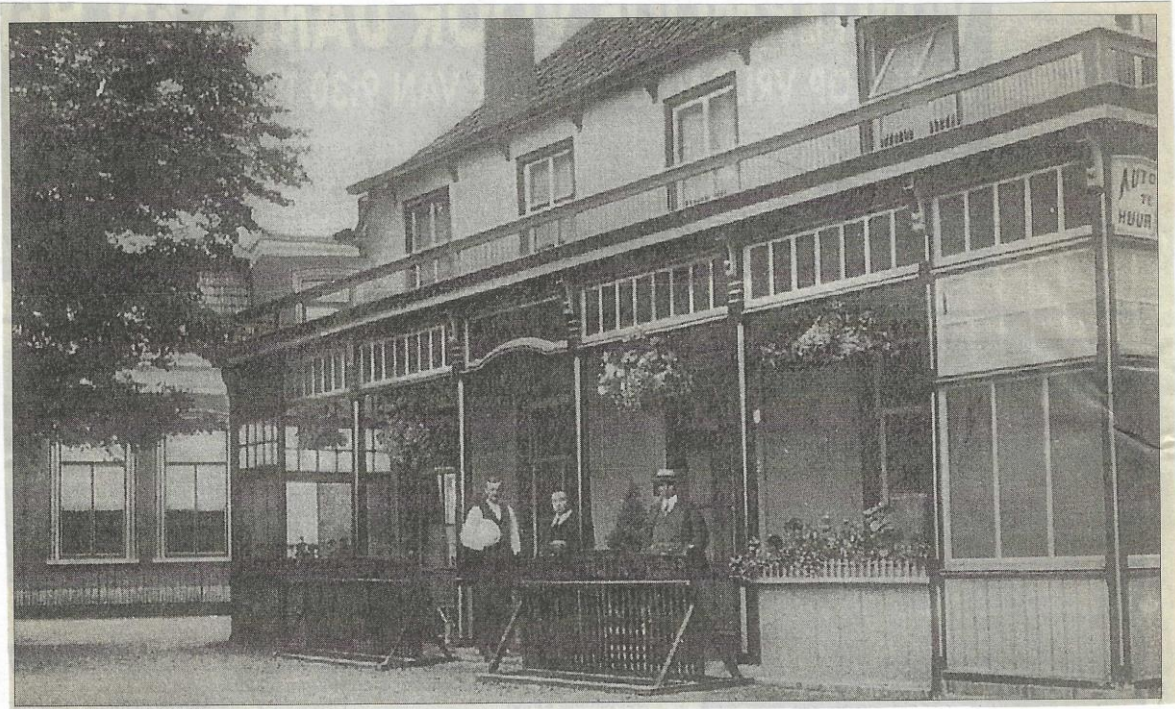
Hotel "de Roskam" omstreeks 1925. In het midden de toenmalige eigenaar Pieter Radersma. De man links lijkt wel de ober-kelner.